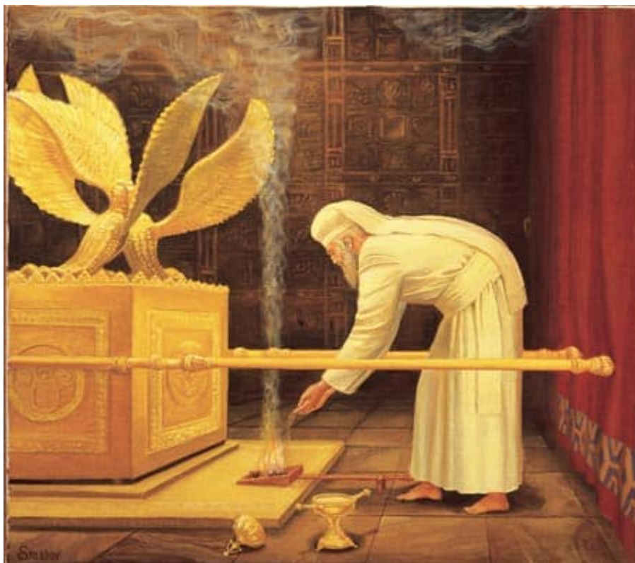
Коэн гадоль в Святая Святых

Служба в Йом Кипур была кошерна, только если она проводилась первосвященником.