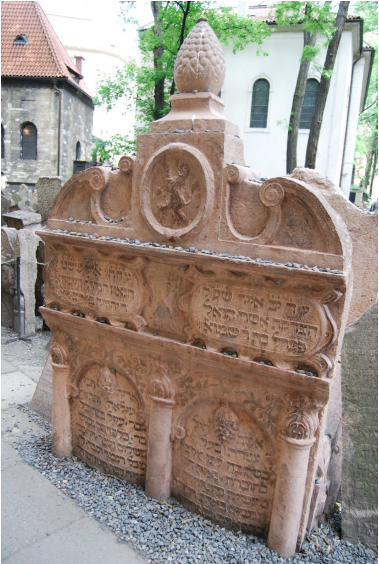
Место захоронения Маараля