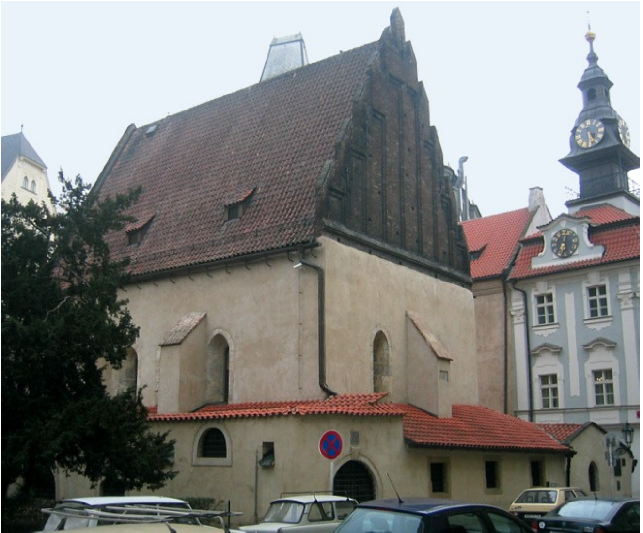
Альтной Шуль – синагога Мааралья

В 5358 /1598/ году Маараль снова возвратился в Прагу, и на этот раз окончательно. Несмотря на то, что и раньше он был общепризнанным духовным главой пражских евреев, лишь теперь, в возрасте восьмидесяти шести лет, он впервые стал официальным раввином города.