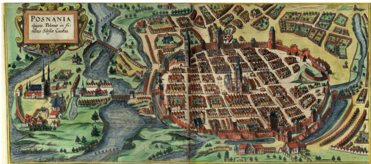
Карта Познани (1617 г.)

Появился на свет в ночь Песаха, в час пасхального седера – в городе Познани, столице Великой Польши. В Польшу его отец, р. Бецалель, бежал от преследований из немецкого города Вормса.