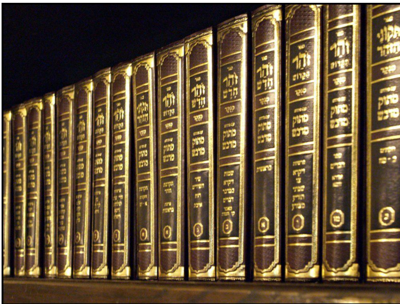
Зоар – основополагающая книга каббалы

Последние шесть лет из двадцати восьми, проведенных в Египте, р. Ицхак посвятил изучению основополагающего кабалистического труда – книги Зоар (Сияние). В этот период он вел жизнь отшельника на пустынном островке, посередине Нила, – в особой святости и духовной чистоте.