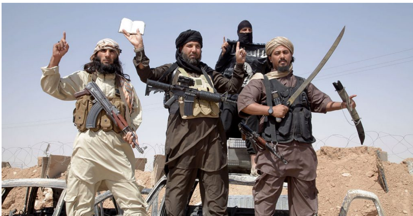
Islamic state fighters removing the border between Syria and Iraq

Призадумаемся, какая личность и какое поведение порождаются двумя этими силами, если они обе находятся в одном человеке. У евреев есть с одной стороны система духовных ценностей, с другой стороны заповеди, конкретная инструкция по формированию личности в соответствии с этими ценностями. У мусульман вторые отсутствуют. У них нет системы заповедей, которая ограничивает естественные силы человека и направляет их в правильное русло. Их вера не только не обуздывает их страсти, она ещё и подталкивает их поступать как им вздумается и считать, что в этом и состоит воля Б-га. Т.е. их вера в Б – га – это всего лишь инструмент, с помощью которого они могут воплотить в реальность свою дикость.