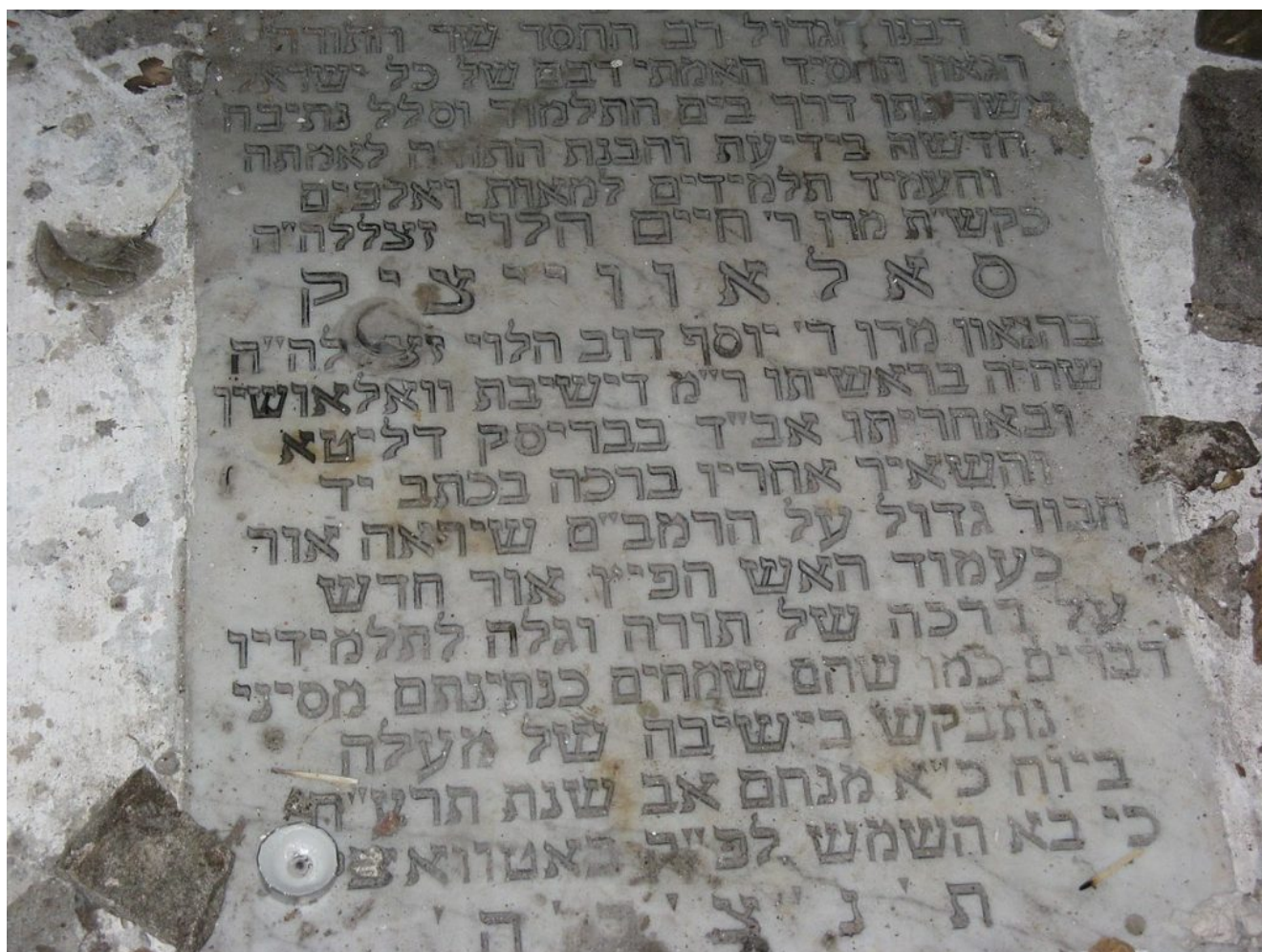
Могилა рава Хаима из Бриска

Р. Хаим Соловейчик умер в 5678 /1918/ году.