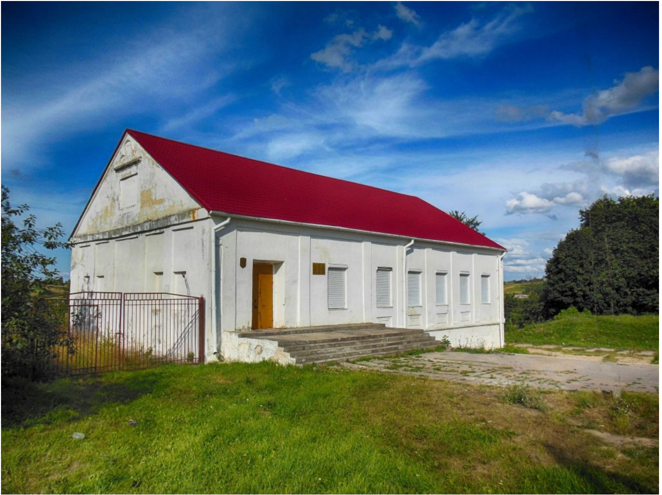
Сохранившееся здание Воложинской ешивы

Его уроки покоряли и завораживали сердца студентов. Он проявил себя выдающимся аналитиком, стремящимся добраться до корней каждого талмудического закона и положения. Многие ученики вспоминали, что после его уроков даже самые сложные фрагменты Талмуда становились ясными и понятными. Почти каждый раз, выслушав его объяснения, ученики не могли сдержать удивленных возгласов: «Если это настолько просто, почему же мы не смогли додуматься сами?!» (там же).