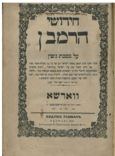
Хидушим на Талмуд

Рамбан проторил новый, магистральный путь в постижении законов Устной Торы – отличающийся и от пути, по которому продвигались авторы Тосафот, и от пути великих кодификаторов Рифа и Рамбама. Тосафисты, стремившиеся максимально точно разобраться